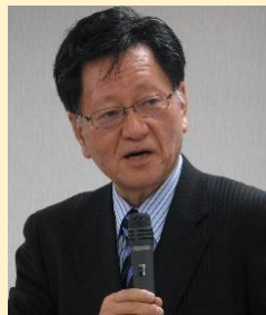
神野 直彦 （東京大学名誉教授、 スローライフ学会学長）