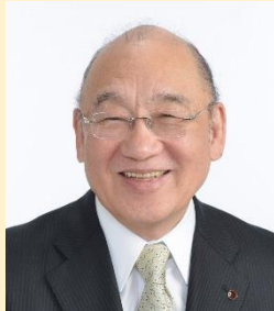
荒井 正吾 （奈良県知事）