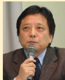
坪井ゆづる （朝日新聞論説委員）