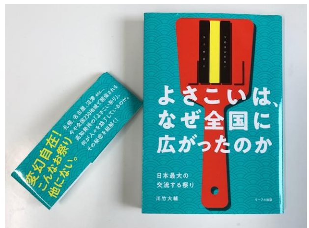
※川竹大輔著 『よさこいはなぜ全国に広がったのか』 リーブル出版