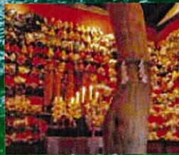
伝承園・御蚕神堂(オンラ堂)